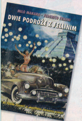
Scenariusz Felliniego w formie rysunku „pędzla” Milo Manary