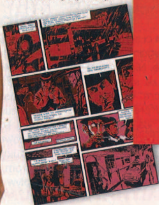
Komiks w modzie (po lewej) i w oryginale: „Pantofel panny Hofmoki” Wojdy i Ostrowskiego (poniżej)