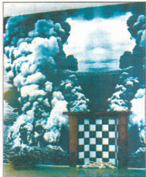
Et vulkanutbrudd på veggen og skjelettpyntede fliser borger for drama på hjemmebane.