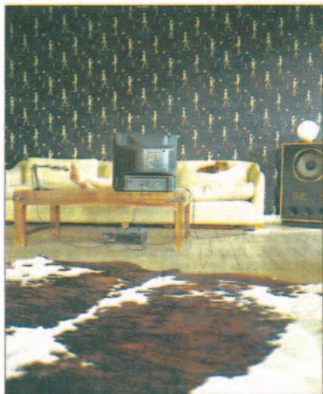
Det som måtte være av skjeletter i skapet går på veggene hos Showroom dummies.